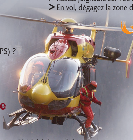
EC 145 de la Sécurité Civile